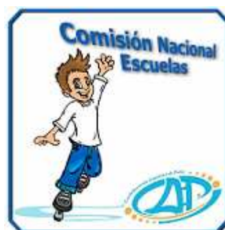
Comisión Nac. de Escuelas