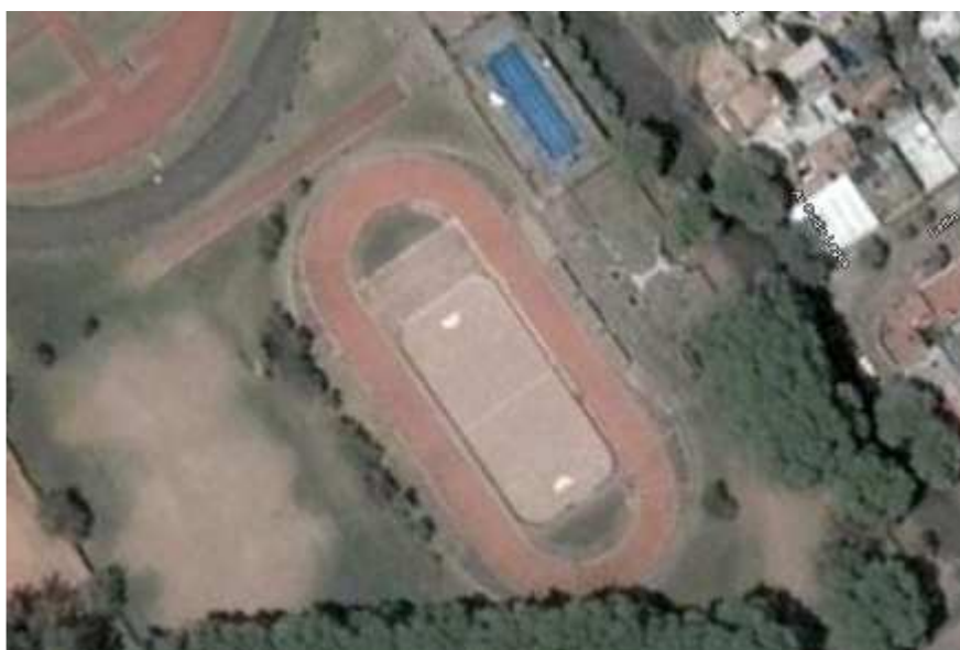
Vista panorámica del Patinódromo Municipal

6. El torneo se desarrollará en las instalaciones del “ Patinódromo Municipal ” ubicado en el Estadio Municipal "Jorge Newbery", en la calle Ovidio Lagos al 2300, de la localidad de Rosario. El mismo tiene una dimensión de 200mts (pista). En su interior tendrá lugar la modalidad de habilidades y destrezas (baldosa).